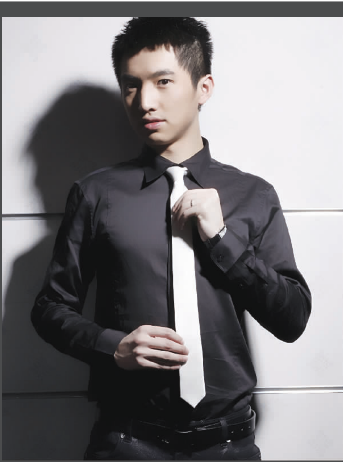
HOPTAHE 黑衬衫 1860元 西裤 1360元 领带 960元 皮带 860元

时至今日,衬衫在男士衣橱里的地位相比以往显得尤为重要。天气暖和了,衬衫+西裤的打扮几乎被大多数男士认为是春季的标准商务装。但不少男人们对商务装也带着自己的看法:“我不爱系领带,因为觉得比较拘束,穿衬衣也可以穿得休闲嘛。再说衬衣都大同小异,怎么穿都可以。”那么是不是什么样的衬衫自己都可以穿呢?答案当然是“不”,如果你不掌握好衬衫的细节,那么个人的品位也会在小细节上被瞬间瓦解。因此,在时尚界自然有了这种说法:“衬衫在以前是领带的背景,现在是视觉的焦点。”