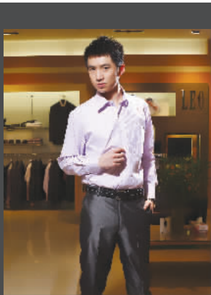
LEO 衬衫 1398元 西裤 1998元