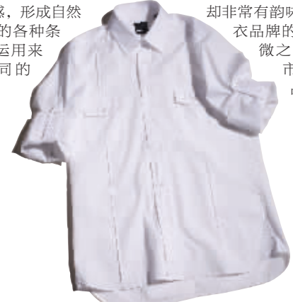
DANIEL HECHTER 衬衫 1490元

精致的绣花和充满浪漫色彩的印花设计,向来是女装的专利,如今都被运用在今年男式衬衣的设计上。经过改良后的绣花和印花,被演绎得自然、飘逸。绣花及印花的颜色也突破了以往仅仅黑白相间的式样,带有热带风情的印花,以及更多鲜艳的颜色在衬衣上显现出来。各大时尚男装品牌,以多色条纹、花朵印花和精美绣花的装饰,或以虚实面料相结合凸现对比质感,形成自然而立体感十足的各种条纹、方格被运用来诠释不同的风格。