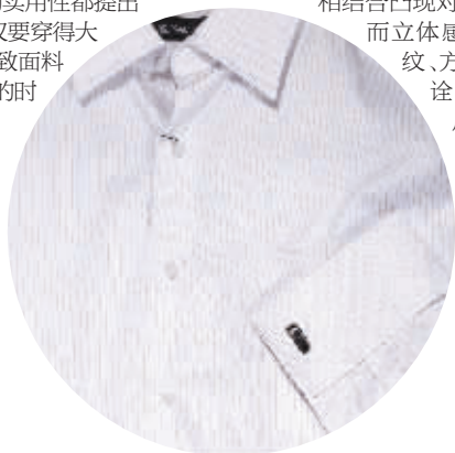
KALTENDIN 双色条纹衬衫 2580元

现在公司白领、企业老总男士和商务人士对于衬衫与场合的百搭性、穿着的舒适性以及免熨烫、水洗防皱等保养简便的实用性都提出了整体而专业的要求。不仅要穿得大方好看,更要求服装的精致面料能让他们在出席各种场合的时候都舒适自然,充满自信。