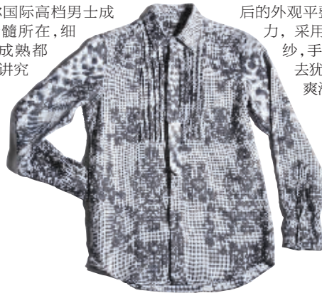
HOPTAHE 衬衫 1660元

相比以往单一的硬挺感,当下的男装设计师更注重商务男装的健康、舒适和实用的功能理念,纷纷采用麻、棉、丝等天然面料,而不同于以往的正装多以毛料为主的风格。如今不少男装都有了防缩水、耐磨、防虫蛀、防静电等功能,而生态面料、纳米服装、香蕉夹克等全新科技性设计也将同样受到青睐。男装品牌CANUDILO的新款衬衫整体提升了成衣洗涤干燥后的外观平整度和水洗抗皱能力,采用了长绒棉和200支纱,手感柔和舒适,摸上去犹如婴儿的皮肤一样爽滑。