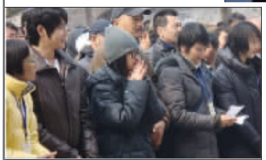
主演参加开机仪式