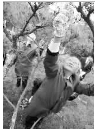
日本友人修剪自己种下的树