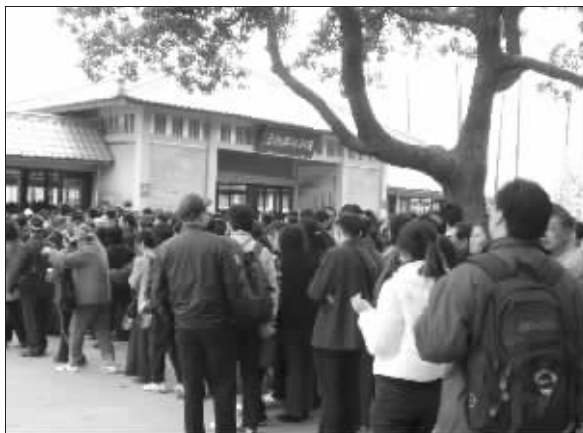
等待坐船上岛的游客