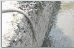
管子通向唐家山沟