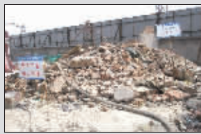
就是这根管子偷排泥浆