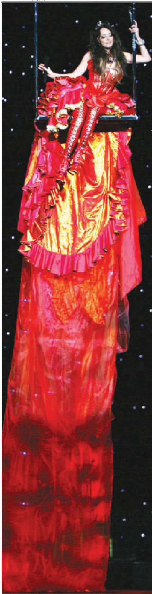
一袭超长红裙惊艳全场