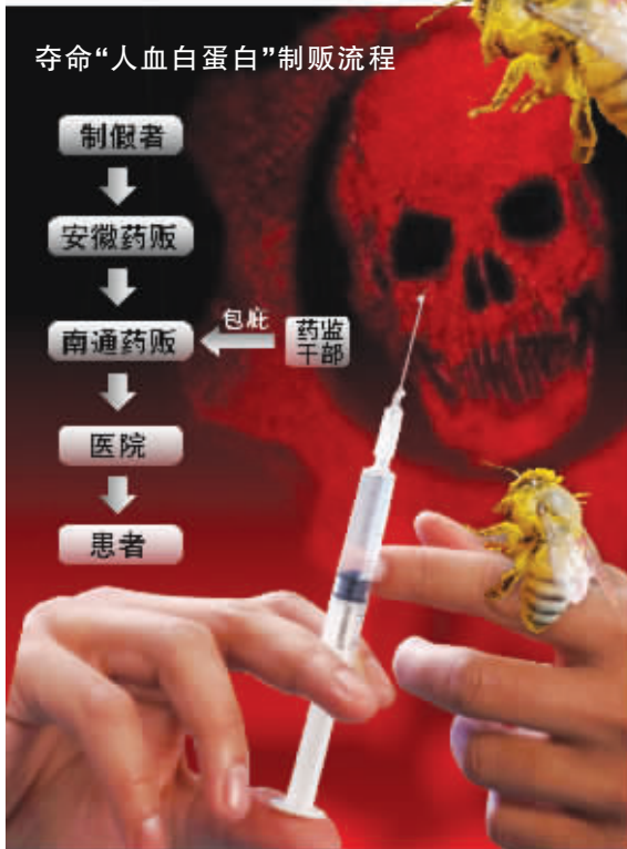
夺命“人血白蛋白”制贩流程