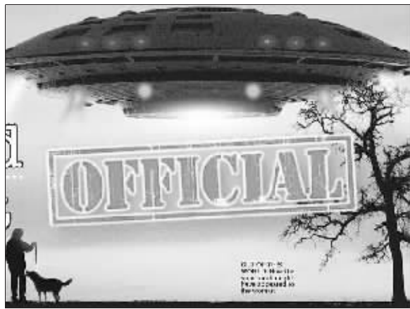
妇女出门遛狗,碰到外星人?

色和白色光芒的巨大球体冲上天空,独自留下了这名惊得目瞪口呆的妇女。这名妇女缓过神来后,立即致电英国皇家空军驻萨福克郡瓦特萨姆市的空军基地,歇斯底里地汇报了这一不可思议的“遭遇外星人”事件。