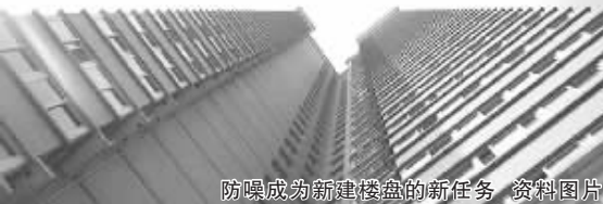
防噪成为新建楼盘的新任务 资料图片

“我这罪算是受大了,四面八方的声音都听得到,邻里之间根本没有秘密可言。”陈女士有些哭笑不得,为了防止自家的声音传到别处,现在一家人都养成了小声说话、小声做事的习惯。他们小区的业主还自建了一个群,大家整天在群里抱怨隔音问题,每家反映的情况都一样。与物业和开发商沟通,对方称楼板符合标准没有问题,便没有下文,“这种近乎赤裸裸的生活,真的让人扛不住!” 见习记者 王凡