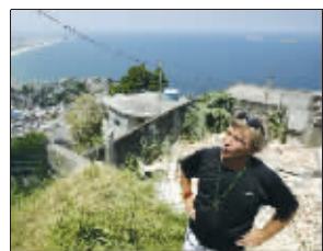
格拉泽准备投资开发贫民窟

资不仅是商业运作,也是一项社会工程。他打算提供资金,让贫民窟居民改善居住条件,为游客提供能吃住的民居。并修建博物馆、开设教育工程,他希望这里的贫民窟“正常”地融入城市。