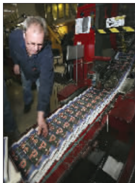
3月16日,工作人员在印刷厂检查最后一期《西雅图邮报》印刷质量(右图)。

美国《西雅图邮报》创刊已有146年。16日,这家百年老报印出最后一期报纸供17日上市,尔后告别“纸质新闻”年代。