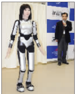
代号为“HRP-4C”的机器人 新华社/法新

HRP-4C的研制费用不菲。据产业技术综合研究所透露,研究人员在它身上共花费超过2亿日元(约合200万美元)。刘鹏(新华社)