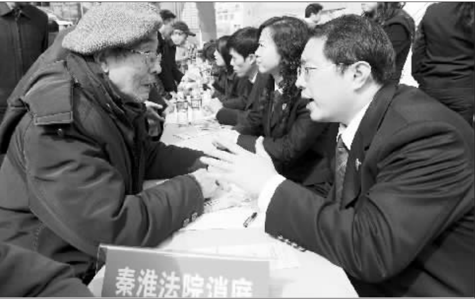
3月15日，快报在新街口万达广场举办大型活动，为广大消费者献上一份“3·15”维权盛宴

新近开张的圈圈网健康生活会馆则忙着给50岁以上的读者派发“百元旅游券”。据说，旅游券可以在圈圈网的所有定点旅游线路中使用。“圈圈网每月都会推出一批百元以内的线路，也就是说，光凭旅游券，不用掏一分钱就能参加一次旅游。”会馆负责人高小姐介绍说，从下周开始，全市多个社区都将设置