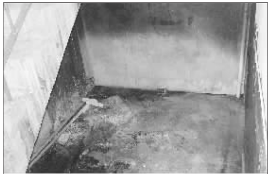
3月4日起火的楼梯间

昨日,《生活无锡》来到锡惠里小区51号楼,底楼的楼梯间已经空无一物,地上、墙上满是火灾后留下的