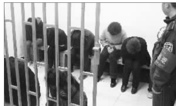
团伙成员集体被捕

“要不要和我‘玩玩’?‘看一看’10块,‘玩一玩’20块。”近日,无锡警方接到市民举报,位于无锡市朝阳广场市民大药房一带,经常会有三五名中年妇女站街拉客,拉客对象均为独自一人的老年男性路人。昨日无锡市公安局治安支队一举将该招嫖卖淫团伙抓获,10名嫌犯全部落网。