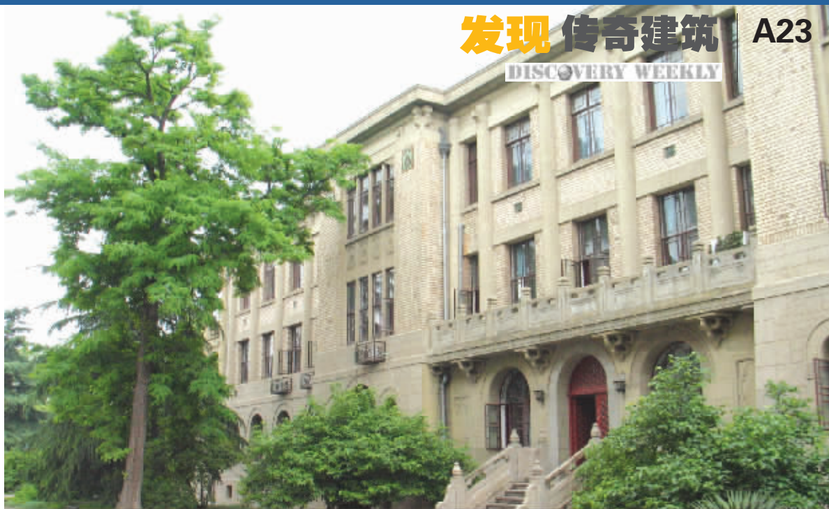
这就是国民政府交通部大楼的庐山真面目

那么,这个让大多数市民不知庐山真面目的国民政府交通部建筑内部究竟是什么样的?围绕着它又发生过哪些不为人知的故事?如今它的真正用途又是什么呢?近日,《发现周刊》走进南京政治学院,近距离地参观了这栋走过七十多年光阴的建筑。