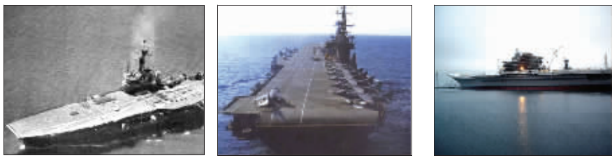
印度购买的三艘航空母舰,从左到右依次为“维克兰特”号、“维兰特”号、“戈尔什科夫海军上将”号(印度已将其命名为“维克拉马迪蒂亚”号)。