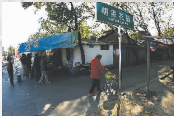
一个十字路口将改造前后的城市鲜明地划分开来

而这里的院子也比二号更为促狭。两层的小楼是典型的明清建筑,却多了几分恬静秀美。居民们的回答则给了这个印象更为可靠的依据:这儿以前是胡家小姐的绣楼和闺房。站在院子中间,犹能见当年的大家闺秀于阁楼深处凝神刺绣的模样,那纤纤的玉指,那婷婷的身姿仿佛也依稀可见,只是太过凌杂的生活场景和搬迁前挥之不去的躁动让这般美好的想象未能深入便戛然而止。