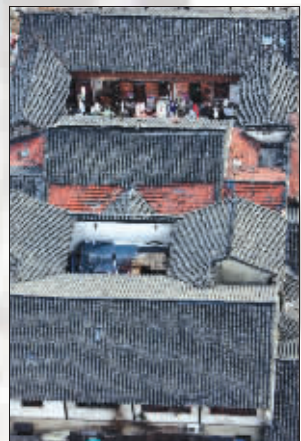
日复一日的生活在这里上演