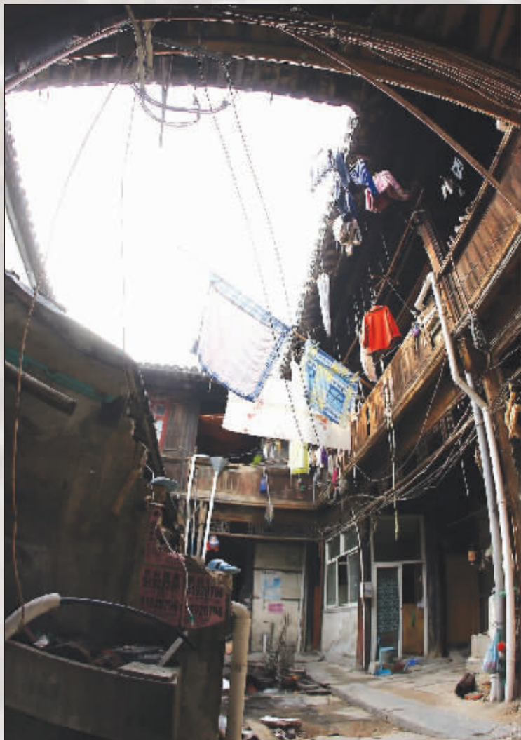
院子里一片狼藉,纵横交错的电线、铁丝、管道随处可见