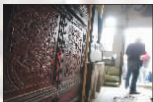
雕花的柜子隐藏不住精致