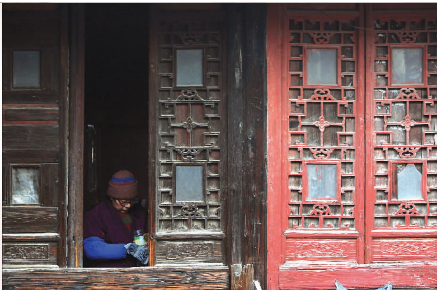
胡家小姐的绣楼,当年的大家闺秀于阁楼深处凝神刺绣的模样只能在想象中寻觅