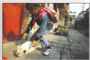
胡同里的生活带给孩子一段快乐时光