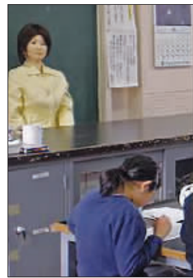
讲台上的机器人老师

日本科学家成功推出世界上第一个机器人教师,目前她已在东京一所小学开始其“试用期”。