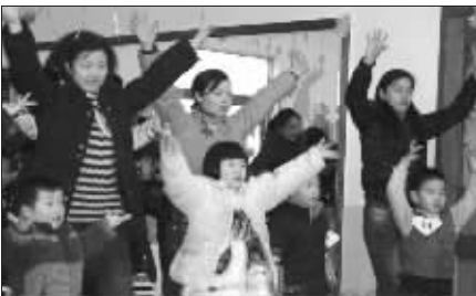
漂亮妈妈和可爱的小朋友一起展示才艺

由现代快报、都市圈圈网(www.dsqq.cn)联合举办的“海思美科”漂亮妈妈大赛终于在3月4日拉开帷幕。首站在南京江宁区机关幼儿园和秦淮龙苑幼儿园华丽展开,吸引了众多“漂亮妈妈”前来参赛,多才多艺的妈妈们用精彩的表演打响了“海思美科”漂亮妈妈第一炮。