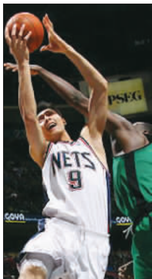
近期阿联状态很一般