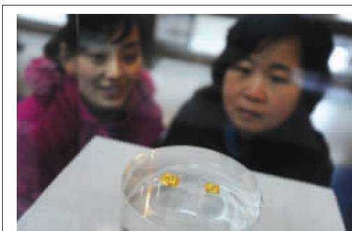
春秋楚国的金币“郢爱”

从古至今,只有这个年代流通过金币,其他基本上是铜、银。而除楚国外,其他国家铸币也都以青铜、铁为原料。因为稀缺,所以它才这么值钱。