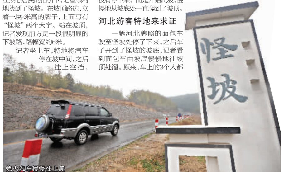
熄火汽车慢慢往上爬

美国犹他州,有一个被人们称为“重力之山”的奇特山,有一条直线距离为500米左右、坡度很大的斜坡道,也是闻名全球的“怪坡”。