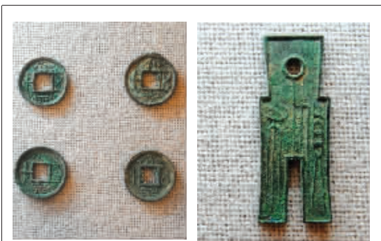
王莽造假敛财的“罪证”大泉五十和货布