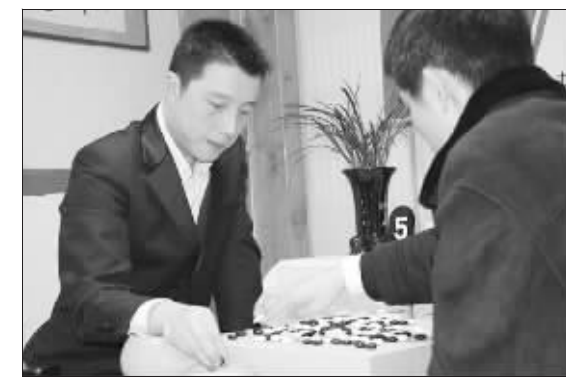
古力(左)一收心,状态就来了

古力选择了和农心杯时一样的下法,反倒是李世石在长考10分钟后选择了新的变化,而这一变,使得黑棋在盘面上拥有了非常明显的实地优势。