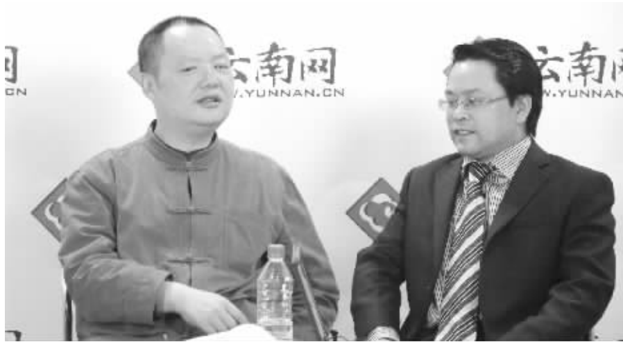
云南省委宣传部副部长伍皓(右)和网友“风之末端”

“躲猫猫”事件本身的争议还远远没有结束,网民及社会人士组成的“躲猫猫”民间调查又掀起了新一轮的关注高潮:达七八成以上的网民,对于这次由云南省委宣传部发起的调查活动及得出的《调查报告》表示强烈质疑。