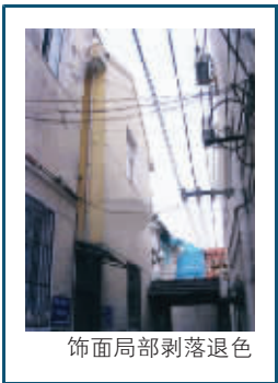
饰面局部剥落退色