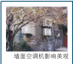
墙面空调机影响美观