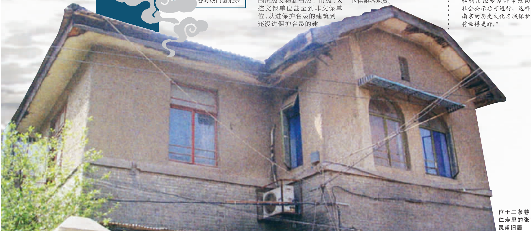
位于三条巷仁寿里的张灵甫旧居