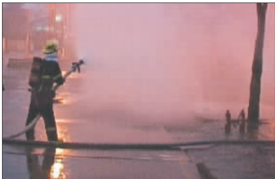
消防队员正在喷水稀释煤气