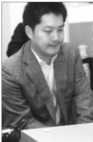
常昊火候还差一点

农心杯昨天继续进行,结果中国队副将常昊执白中盘不敌李世石。这样,志在卫冕的中国队将面临古力一人独斗韩国“二李”的局面。