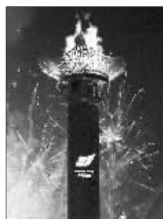
大冬会主火炬熊熊燃烧

瑞雪初定,春蕾新发,哈尔滨在春天的脚步里迎来第24届世界大学生冬季运动会。第24届大冬会是北京奥运会和残奥会之后,在中国举办的第一个世界性综合运动会。昨晚,大冬会正式开幕。