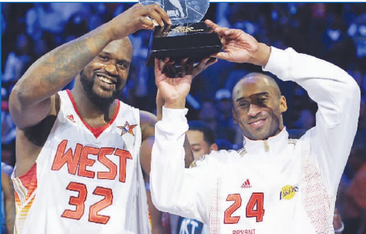
曾经的冤家如今共享MVP荣耀

37岁的奥尼尔用出色的体能优势在赛场上尽情挥洒着娱乐精神。奥尼尔扮演着中锋到后卫的任何角色,要证明他不只是搞怪,赛场上自己的力量、速度、耐力、柔韧不输给任何球员。奥尼尔是国内知名体育用品品牌李宁旗下的签约运动员,在全明星赛前还参加了中国媒体见面会,会上他再三强调:“要在NBA立足,就必须要有良好的体能,这包括力量、速度、耐力、柔韧等,体能是技术发挥的最基本保障。有了体能,斗硬,谁怕谁!” 新文