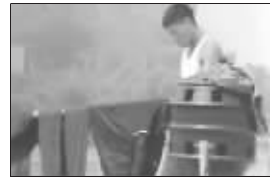
大桥下船厂内晾晒的衣服入了镜头