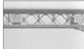
影片中的长江大桥