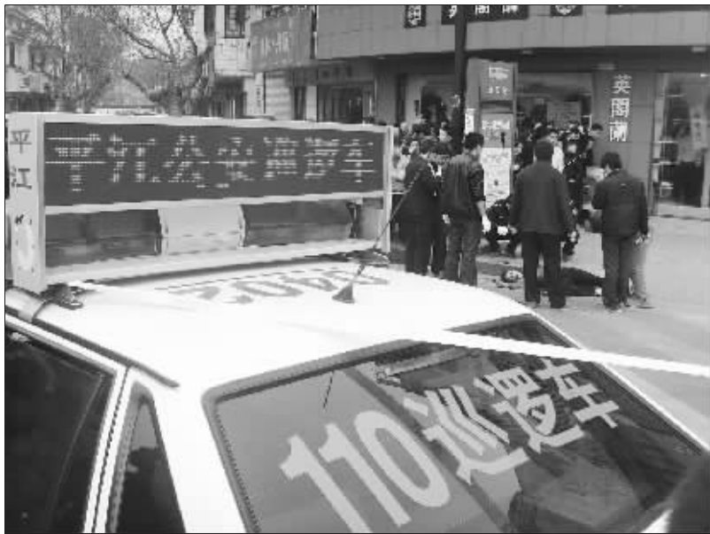
民警正在勘察案发现场