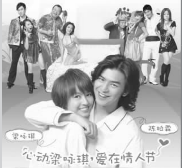
心动梁咏琪,爱在情人节