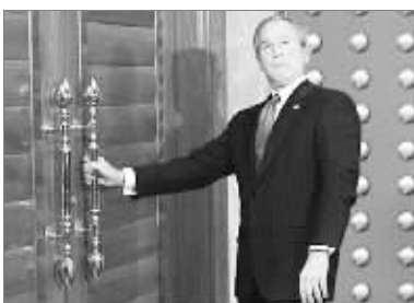
奥巴马:嗯,这儿有个门……不对,原来只是个窗户。