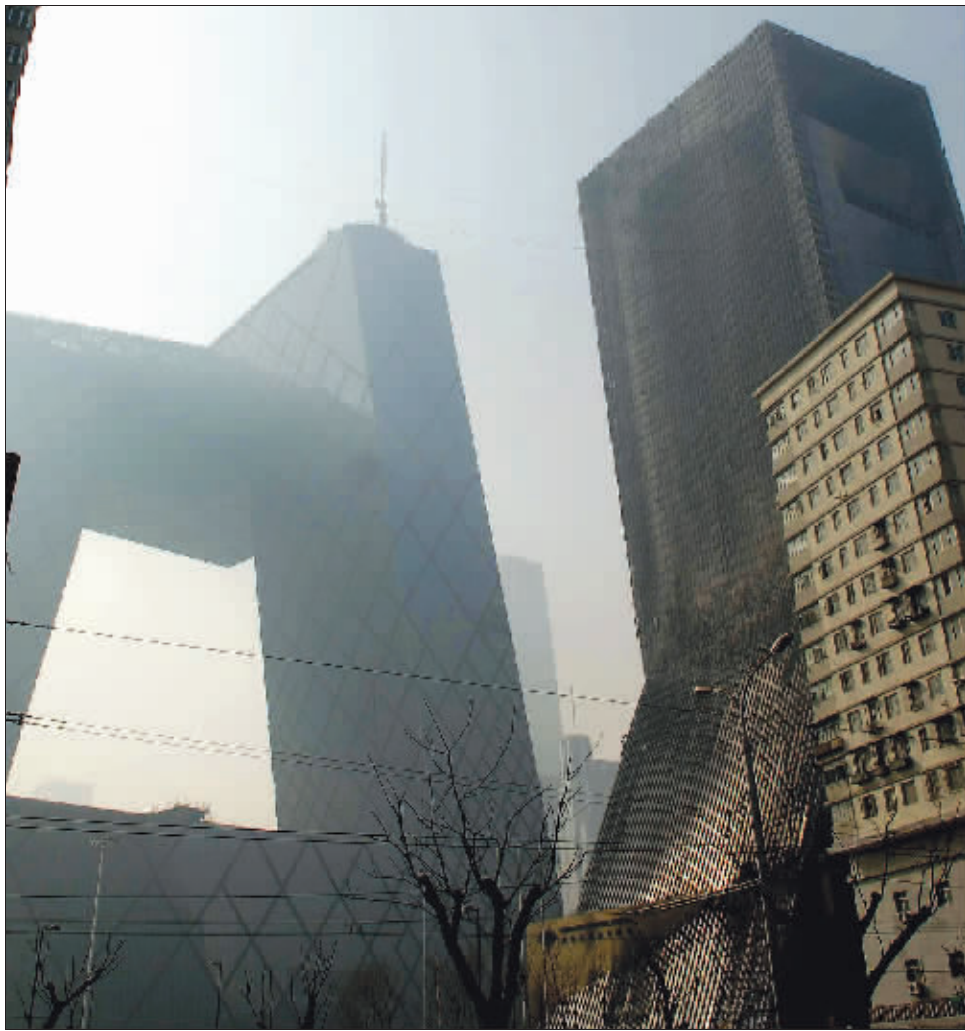
过火后的央视新址园区附属文化中心大楼外立面受损严重