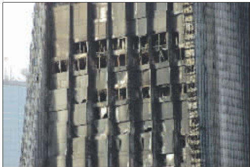
◀北配楼外壁遭到大火破坏综合