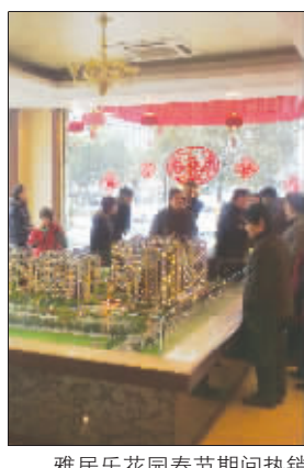
雅居乐花园春节期间热销

2008年载誉而归,2009年新春迎喜,雅居乐花园一直保持着精工建筑、诚信开发的行事风范,100%准现房销售是企业以客户满意为目标的最好写照。