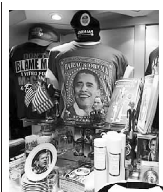
奥巴马主题商品铺天盖地

以奥巴马为主题的商品更是铺天盖地。仅网络零售商 WholeSale.com 一家,跟奥巴马有关的商品就有 455 种,从玩偶到鼠标垫,从腰带到领带,从棒棒糖到雪茄,几乎应有尽有。一些市场专家估计,奥巴马商品创造的利润,现已达数十亿美元。美国政治名人纪念馆商店的华盛顿零售商吉姆·沃里克说:“我能想象到的能与他相媲美的人,可能只有教皇。”芝加哥德保罗大学市场营销教授布鲁斯·纽曼说:“实在太令人吃惊了,而且这股热情