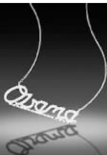
奥巴马字样的项链