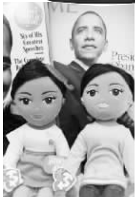
奥巴马夫人对玩偶上印有女儿名字很不高兴

可能持续的时间会很长。”居住在华盛顿的珠宝商安·汉德日前推出了一系列与奥巴马有关的珠宝和饰品,包括售价 175 美元的太阳镜,眼镜的边框上镶有用水晶拼出的“奥巴马”字样。美国《时尚》杂志的编辑安