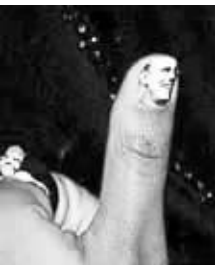
奥巴马上了大拇指