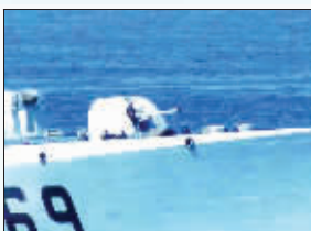
我海军官兵严阵以待