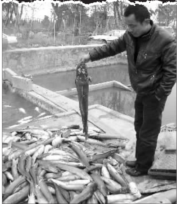
看着死鱼,老板很痛心

两位养鱼人告诉记者,他们打算初八就将这些鱼上市,“按照目前每斤3元的市价,共计约90万元。90万啊……我们借了那些债啊……”