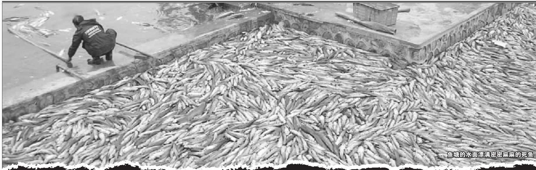
鱼塘的水面漂满密密麻麻的死鱼