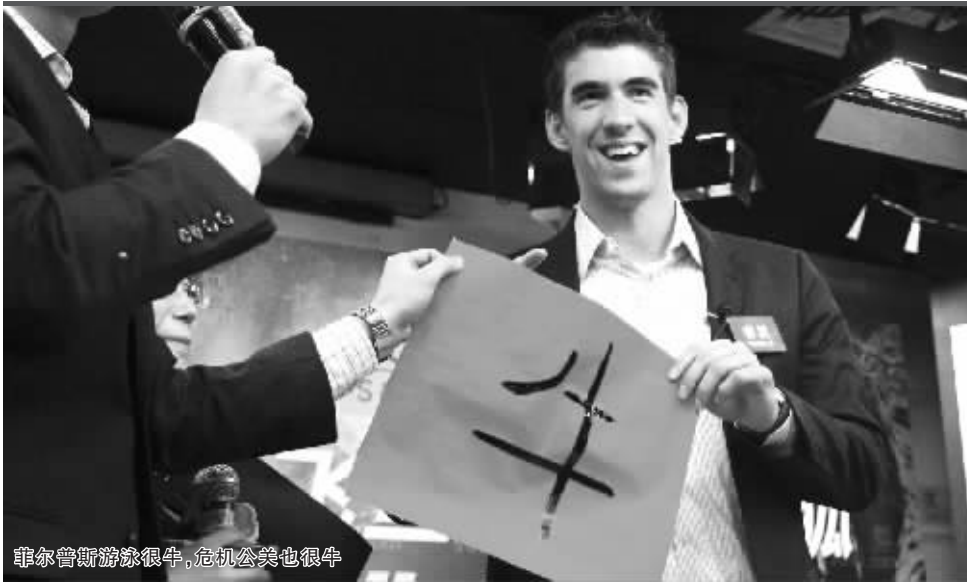
菲尔普斯游泳很牛，危机公关也很牛

菲尔普斯，北京奥运会的“八金王”，如今却因为吸食大麻成了全世界人议论的焦点！好在，他第一时间承认吸食大麻的事实，第一时间向世人道歉，菲尔普斯在最短时间内作出了最明智的选择。中国某门户网站上的一个民意调查显示，在菲尔普斯道歉之后，有53.4%的网友选择理解并继续支持他。除此之外，国际奥委会、美国奥委会、国际泳联等组织都表示不会处罚菲尔普斯，就连各赞助商也纷纷表示不会因此抛弃飞鱼。由此看来，此次吸食大麻事件，菲尔普斯的危机公关取得了全面性胜利。