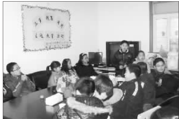
近日,茶山街道社区的阳光驿站开展了“压岁钱我该怎么用?”主题教育活动,十多位社区里的小朋友围坐在一起讨论今年的压岁钱该怎么花。