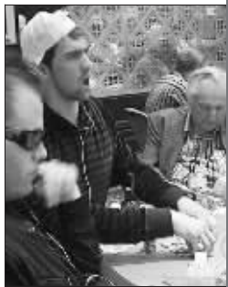
沉湎于拉斯维加斯豪赌