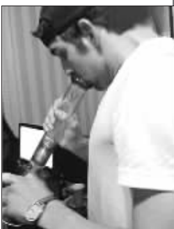
就是这张照片成为菲尔普斯吸毒的确凿证据