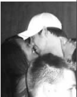
在夜店与女伴疯狂热吻