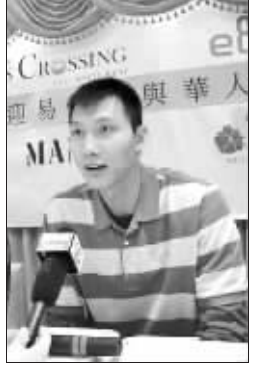
阿联受到美国华人追捧

人新春快乐,身体健康。他同时希望身在美国的华人时刻保持乐观向上的心态,克服前进道路上的困难,在新的一年里继续向前,取得新的成就。