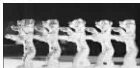
图为已经铸造好的金熊、银熊等奖项的奖座