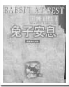
图为著名的《兔子四部曲》封面