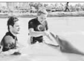
希拉里·达芙和男友迈克

据外媒报道,希拉里·达芙近日与NBC电视台签署过一份合同,而这份合同的具体内容就是达芙即将出演NBC电视台的新喜剧《俏律师新上路》的女主角。看来,达芙这次度假是在忙碌之前