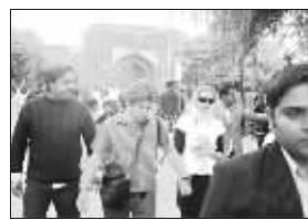
罗伯茨和老公尽显甜蜜