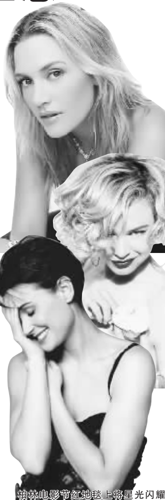
柏林电影节红地毯上将星光闪耀