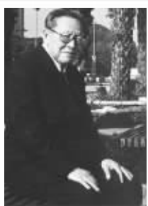
武侠小说家梁羽生

电视剧《七剑下天山》同样没获得多少好评。该剧难逃节奏缓慢拖沓的恶评。拍惯电影的徐克想在刀光剑影与缠绵悱恻中加入很多深刻话题的探讨，没想到遭到观众的唾弃。