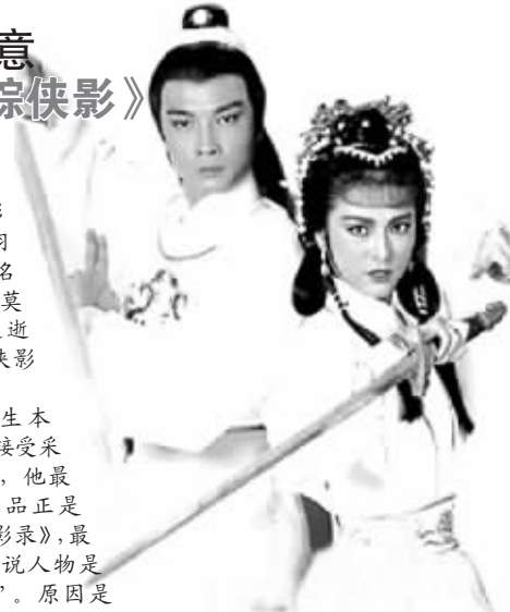
刘松仁和米雪主演了1984版的《萍踪侠影》