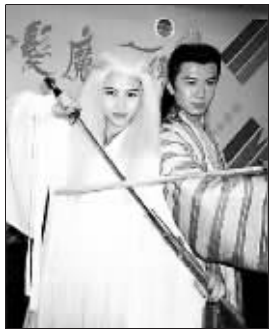
蔡少芬版《白发魔女传》