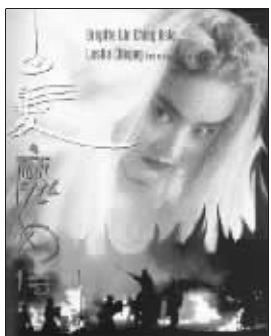
林青霞版《白发魔女传》