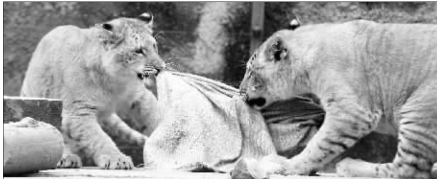
麻袋里装上肉块让三只狮虎兽玩得不亦乐乎

还记得不久前快报报道的红山动物园打算给动物进行丰容改造的消息吗，这项提升动物生活“幸福指数”的工作已经开始，红猩猩、金丝猴、大熊猫等最先享受起丰容带来的乐趣。春节期间，红山还邀请市民来给它们的“幸福指数”打打分，看看哪些丰容工作合理，哪些还需改进。同时还有机会亲手参与这些有意思的工作，比如折纸青蛙、编鸟巢。