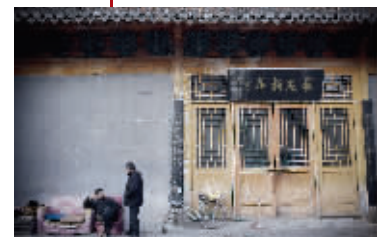
大殿门柱上的油漆已经掉了不少