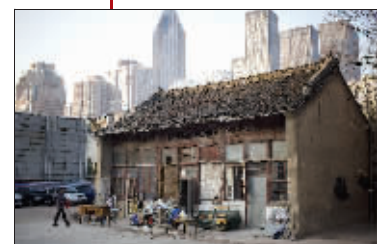
这里难找荣耀,衰败感迎面而来