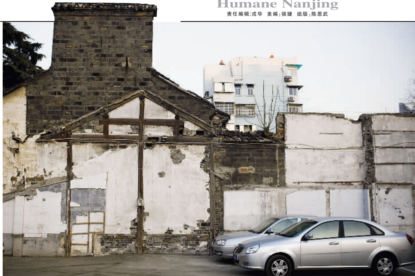
李鸿章祠堂原址的一部分已经变成居民区