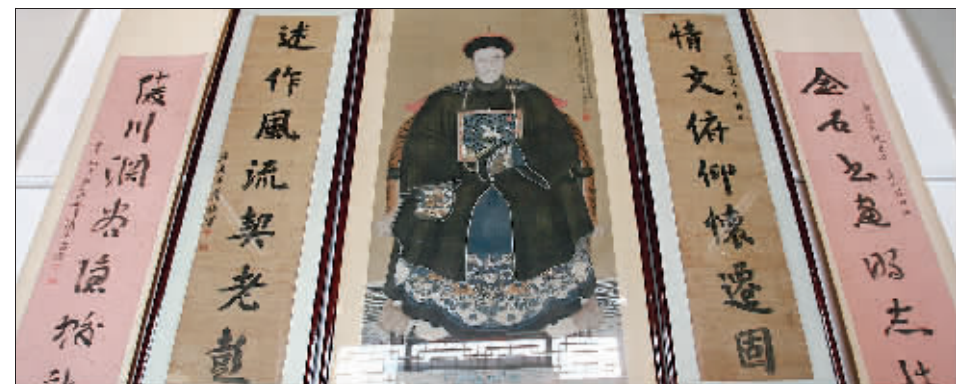
大殿内悬挂着李鸿章像和对联