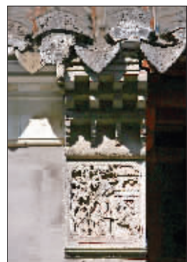
瓦檐、石刻经过了时间的打磨,岁月的味道变得清晰