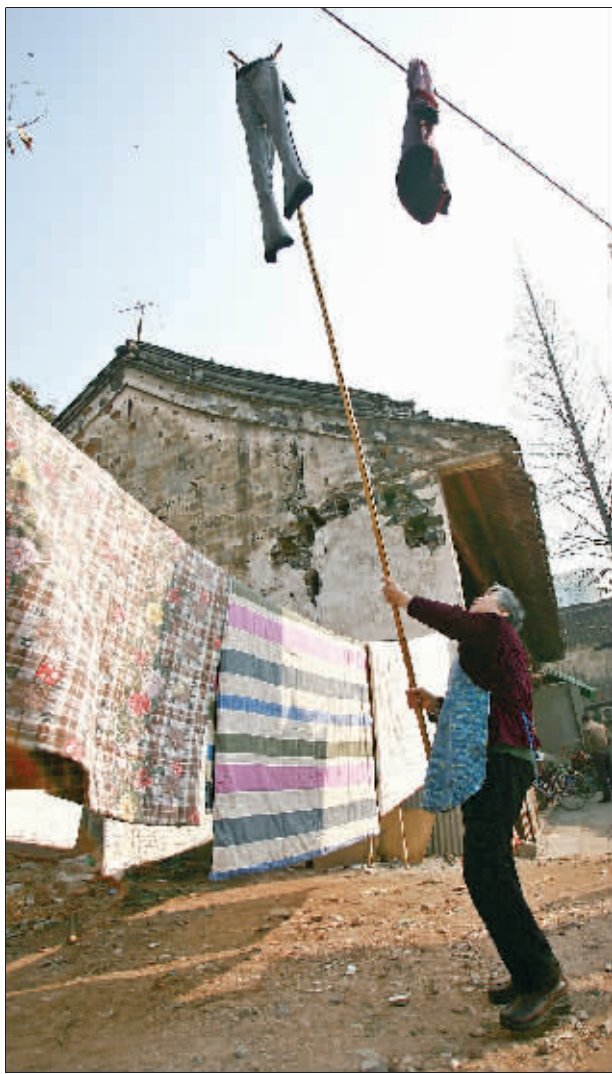
冬日暖阳,老太太抓紧晾晒被子和衣物