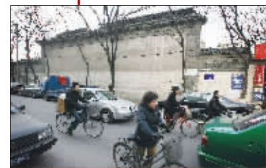
行人匆匆而过,祠堂内外两种节奏