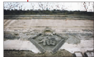
福字在墙上生根发芽