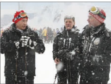
1月3日,俄总统梅德韦杰夫(右)和总理普京(左)一起滑雪过新年。

《新消息报》记者也决定将自己的问题发给总统。一开始,网页建议他们先了解规则并注册。规则中指出,所有评论都要经过预先“过滤”,如果宣传仇恨和歧视,包含侮辱性和威胁性的内容,甚至有商业目的,都不会在网上发布。 信莲