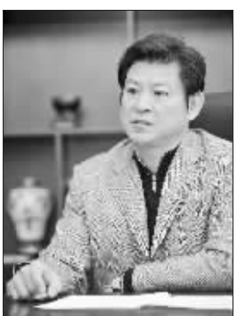
汪扬 南京市人大代表、河西新城开发建设指挥部常务副指挥长