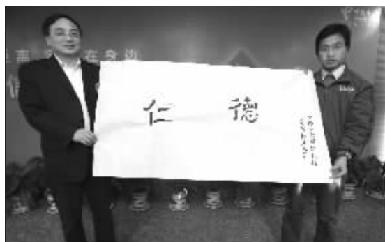
孩子们送上书法作品“仁德”表谢意