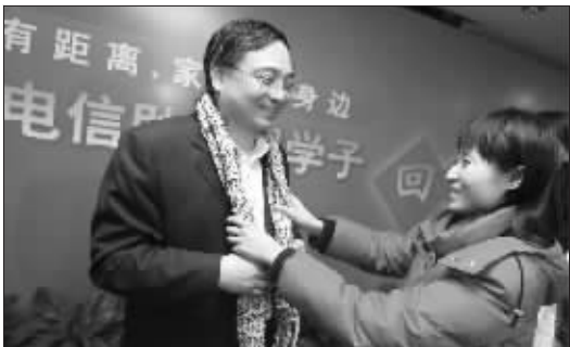
记者将孩子们亲手织的围巾送给中国电信江苏公司总经理

还有一份特殊的礼物,也在这场温情的活动中献出。很多人都不会忘记,南京高等职业学校甘肃班学生在临行前留下了两条亲手编织的围巾,并叮嘱道:“帮我们交给南京的好心人。”昨天,快报记者特意已经平安到家的45名同学转达了这份心意,“这是两条特殊的围巾,买毛线的16块钱都是孩子们省吃俭用攒下的……”“这是真正的温暖牌,我会好好收着!”陈总连连感慨,自己的围巾不少,但这条却最珍贵。