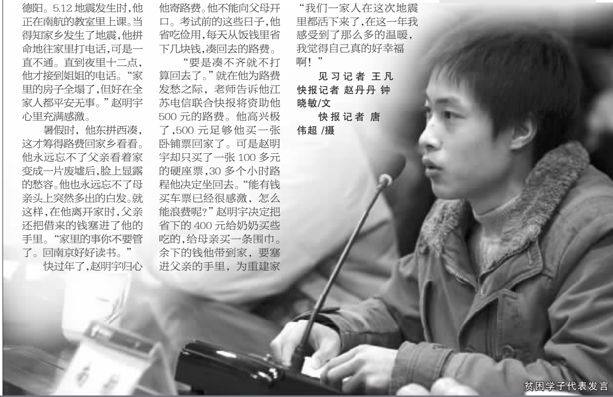
贫困学子代表发言