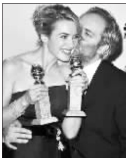
获奖后接受家人的亲吻

感谢经纪人,还要感谢导演,他必须用我这个默默无闻的演员来拍摄一部好的影片。他不喜欢我说他很严厉,但实际上就是个很严厉的混蛋……感谢我的狗,当我孤独的时候只有狗在身边。”