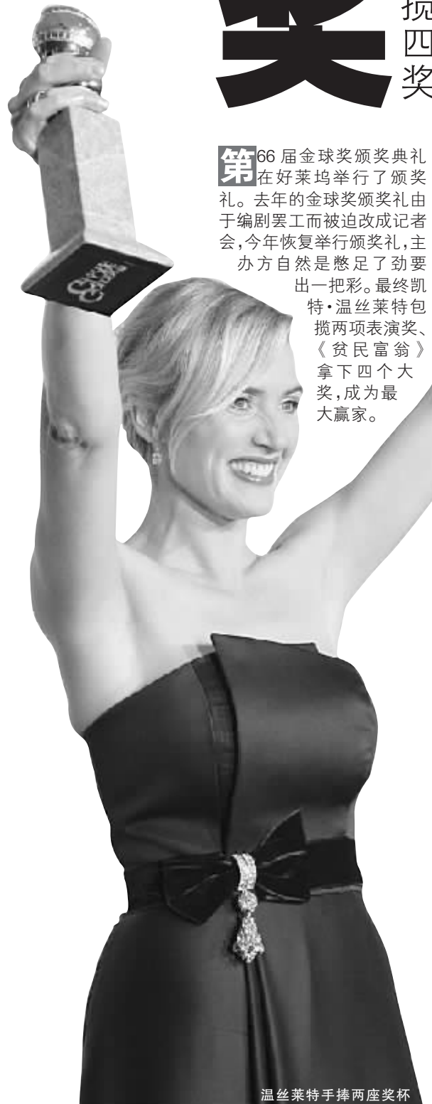
温丝莱特手捧两座奖杯

浪子回头金不换。在全球经济危机、美国总统换届的2008年过后,肯定一部鼓舞人心的阳光之作,当然比“恐怖主义真人秀”的《蝙蝠侠》更有意义。 毕成功