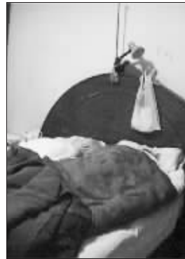
▼两位老人惨死在床上。其中一位正在上床,被子刚掀开,人就倒了。