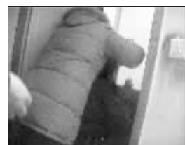
▲民警和死者亲属正在试图打开卫生间的门,小女孩和她的妈妈就躺在里面。

警方也提醒市民,在使用燃气热水器时,应开窗通风;定期维修燃气管道及设备,及时更换老化的连接管道和损坏设备,以防漏气。晚上睡前须关闭阀门,燃气使用完毕请及时熄火;一旦发现有中毒者,应立即打开门窗流通空气,尽快将其移离中毒现场至通气处,松开衣领,保持呼吸通畅,注意保暖。对昏迷的患者应尽快送往医院救治。