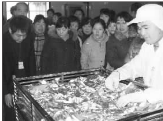
看,酱排骨是这样做出来的!