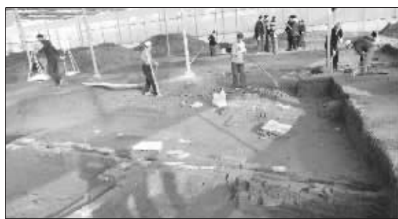
考古现场挖出叠压的排水沟