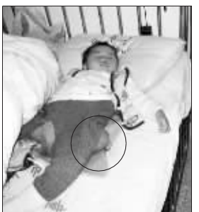
孩子屁股上又长出了肿块(图中画圈处)

奇怪,脱下孩子的裤子一看,孩子屁股上又长出了一个约有鸽蛋大小的肿块,位置就在上次手术的刀疤边上。徐文举带着孩子再次回到常州儿童医院,诊断结果证实了他的猜测,一家人刚刚放下的心再次又被提了起来。“我们问了下医生,医生说目前孩子只能先进行化疗,等肿瘤小一些才能考虑手术切除。但2次手术加上四处求医,我们已经花去了2万多,家里就我一个人拿着每月近1千的工资,我老婆也没工作……”现实的残酷让这个家庭陷入了绝境。